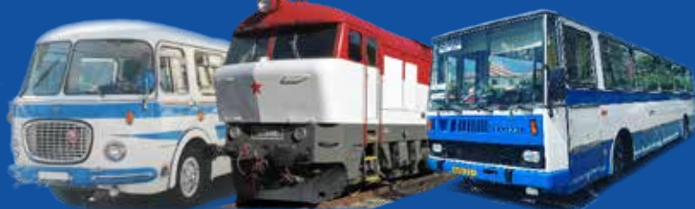
Změna vozidel vyhrazena. Ilustrační fotografie.

První dva prototypy nových traťových motorových lokomotiv T 478.1 byly v ČKD vyrobeny v roce 1964 a na jaře roku 1965 nasazeny do zkušebního provozu. Výrazně tvarované čelo z laminátu dalo lokomotivám jméno „Bardotka“. Charakteristický zvuk motoru k nám jezdí obdivovat nadšenci z celého světa. První vyrobená lokomotiva T 478.1001 je domovem v Brně.