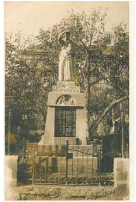
Pomník obětem první světové války