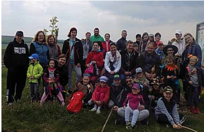
Čarodějnice a plnění úkolů v lese